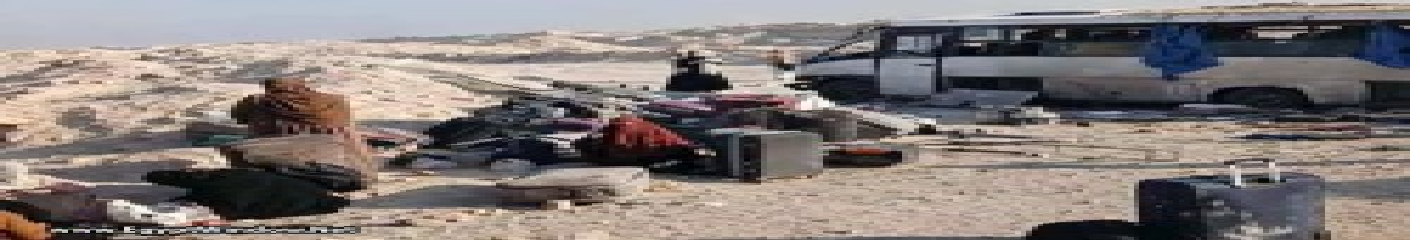
بالصور: إصابة 18 طالبة في حادث أنوبس بطريق الصعيد الحر بالمنيا الخميس 9 أبريل 2026 11:20 م