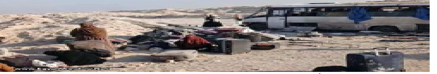
بالصور: إصابة 18 طالبة في حادث أنوبس بطريق الصعيد الحر بالمنيا الخميس 9 أبريل 2026 11:20 م