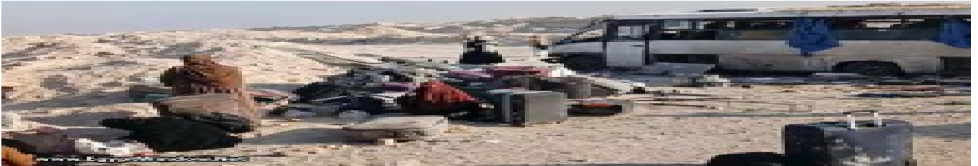
بالصور: إصابة 18 طالبة في حادث أنوبس بطريق الصعيد الحر بالمنيا الخميس 9 أبريل 2026 11:20 م